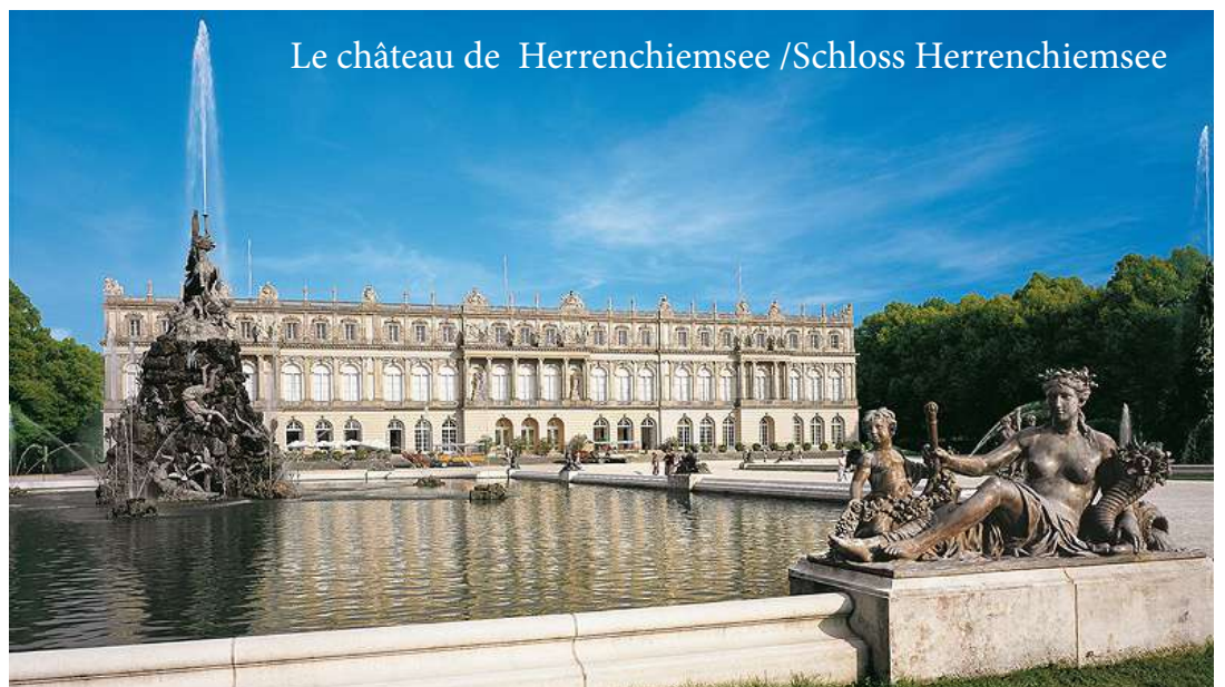
Le château de Herrenchiemsee /Schloss Herrenchiemsee