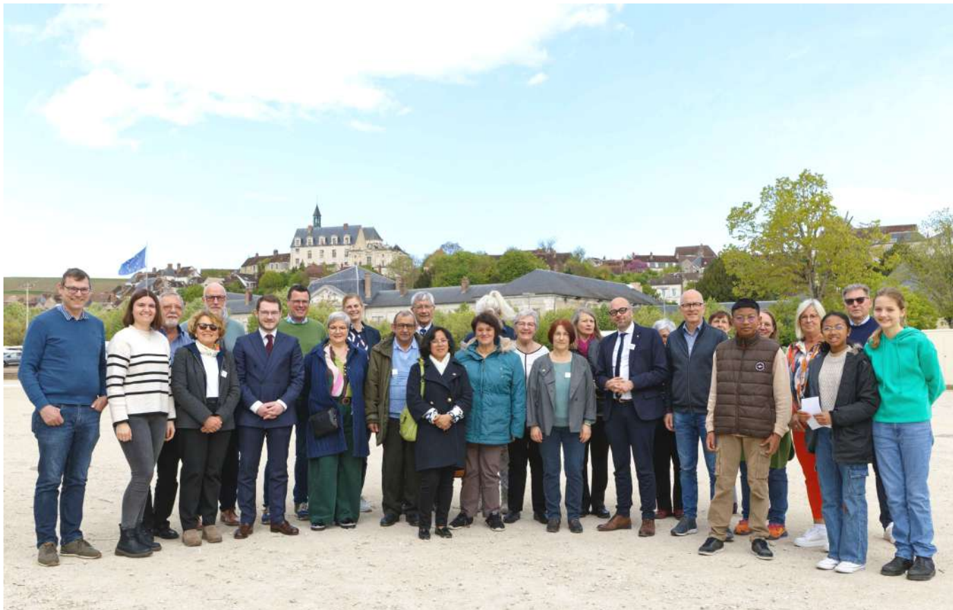
Avant le déjeuner dans un restaurant jovinien. Vor dem Mittagessen in einem Restaurant in Joigny.