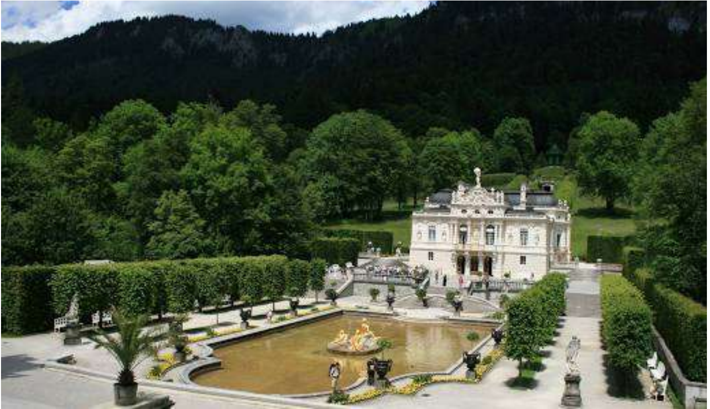
Le château de Linderhof / Schloss Linderhof

Ci-contre, la façade baroque d'une maison d'Oberammergau.