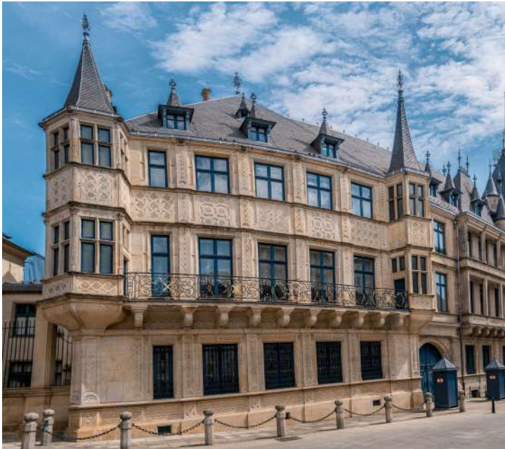
Le palais grand-ducal de Luxembourg.