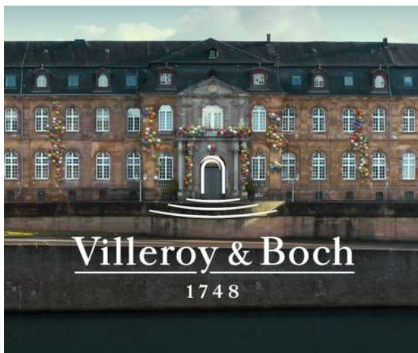
Le siège de l'entreprise Villeroy et Boch, mondialement connue.