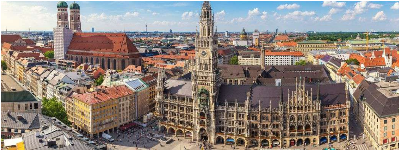
Munich, son hôtel de ville au bord de la « Marienplatz » et en arrière-plan sur la gauche l'église Notre Dame. München, sein Rathaus am Marienplatz und links im Hintergrund die Frauenkirche.