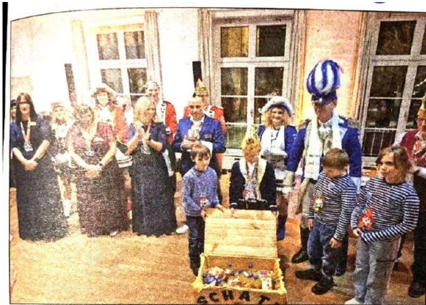
Unter dem Motto „Es lebe die Freundschaft“ wurde ein gelungenes Fest gefeiert.

Sur la photo ci-dessus, le jeune prince de carnaval reçoit en guise de cadeau pour sa présence à la tête de sa suite et, avant les festivités du carnaval de Mayen prévues pour le mois de février, un coffre à trésor en bois et sa princesse fleurs. Le cercle a, par ailleurs, accordé un soutien financier au comité du carnaval en prévision de son engagement du début de l'année 2025.