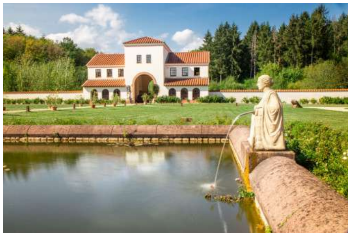
La villa Borg. Die Villa Borg.