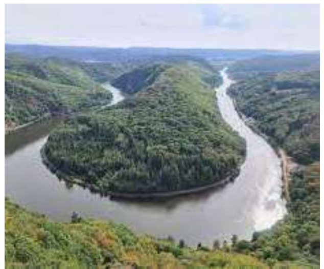
la boucle de la Sarre/ die Saarschleife