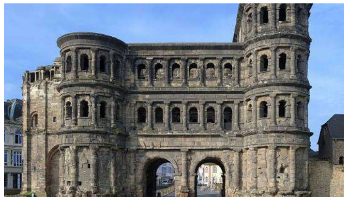
Trier : die Porta Nigra