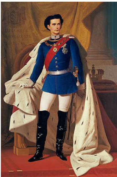
Louis II roi de Bavière (1845/1886), ici en stature de général bavarois drapé dans sa tenue royale. Il fut l'instigateur de la construction des deux châteaux de la page précédente auxquels il faudrait ajouter Neuschwanstein.