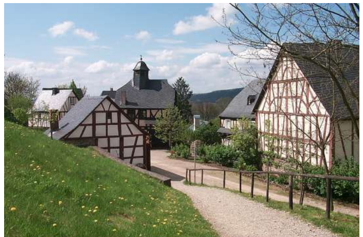
Der Roscheider Hof, ein Bauernhof, der ein Heimatmuseum beherbergt.