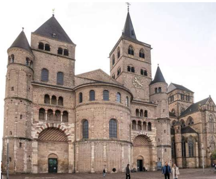
La basilique de Constantin.